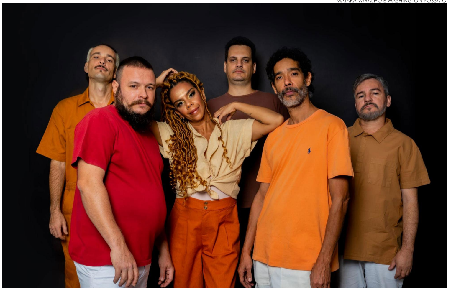
Música preta brasileira: Mundhumano leva para Piri repertório de samba-rock conhecido nos bares da Capital

O Palco Teatro, situado no Teatro Pompeu de Pina, não só abrirá o festival, como também servirá como local de gravação para o Estúdio Primavera. Já o Palco Matriz, na Praça da Matriz, e o Palco Coreto, na Praça do Coreto, continuam a ser espaços tradicionais e importantes para o evento. Mundhumano