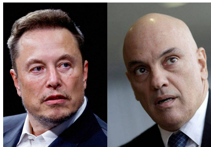
Elon Musk e Alexandre de Moraes: decisões da Justiça brasileira não cumpridas

Como Moraes decidiu enviar o processo para julgamento da Primeira Turma, e não do plenário