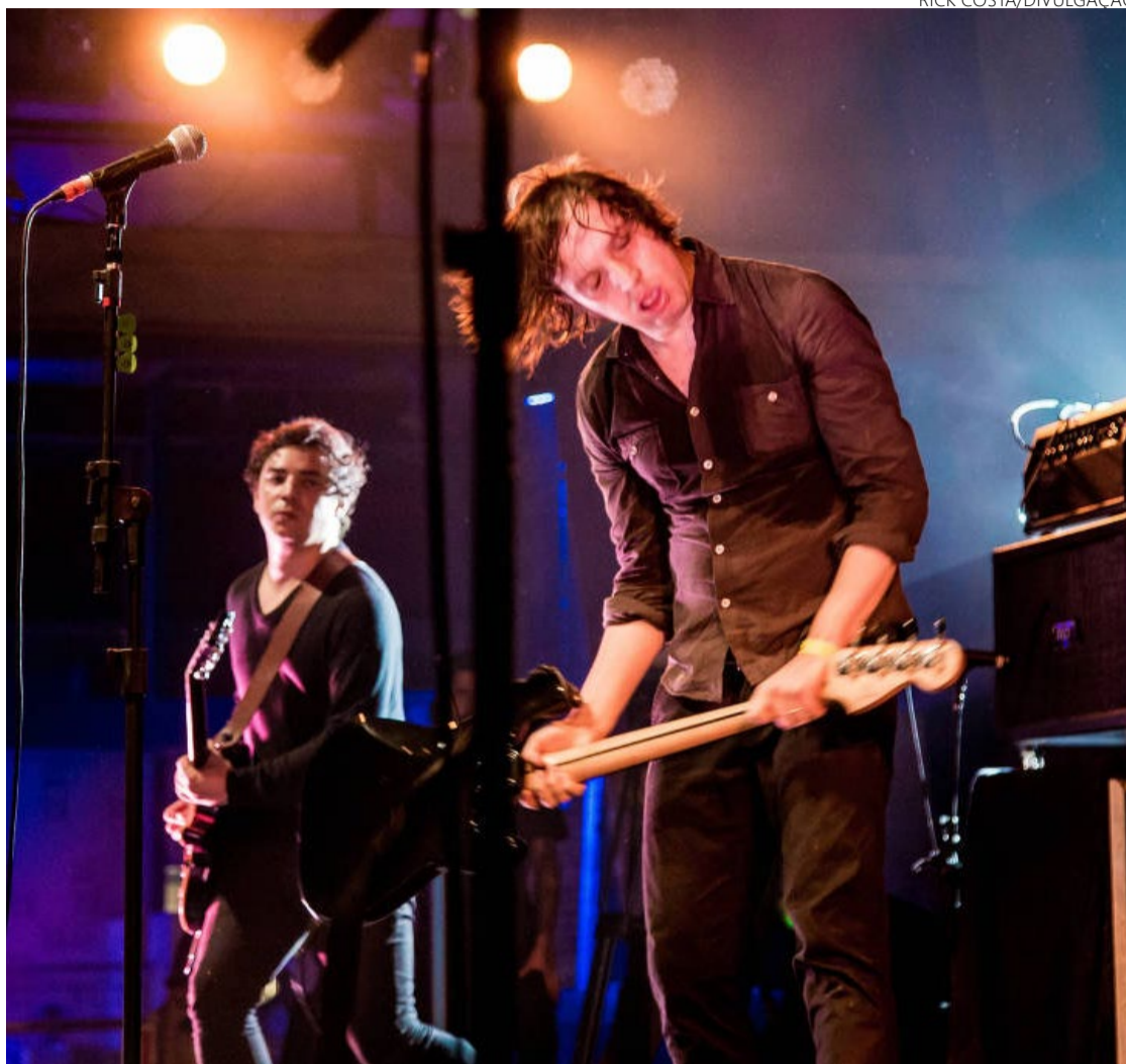
Conquistando fãs: grupo toca em apresentação realizada no Sesc Pompeia, em São Paulo

“Servil” — composto e gravado quando os integrantes tinham 20 anos ou menos — segue relevante por lidar com a “inquietação característica da passagem da adolescência para a vida adulta”, afirma Naves, acrescentando que o