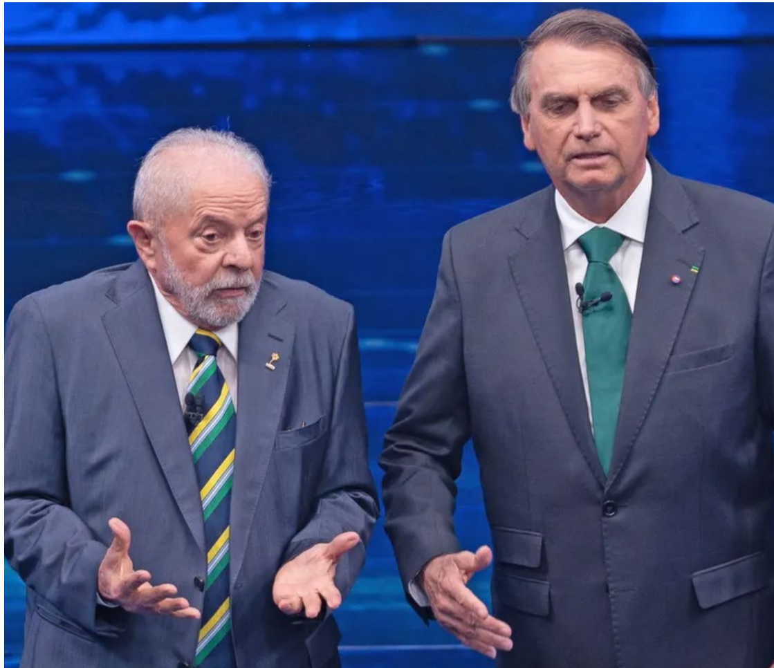
Lula da Silva e Jair Bolsonaro: quebra-de-braço na disputa pelas eleições municipais

No Centro-Oeste, há dados para 2 das 3 capitais: Cuiabá e Campo Grande. Bolsonaro está