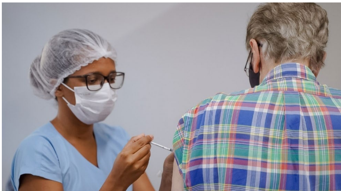
Grupos prioritários devem receber dose de reforço anual da vacina contra a covid-19 em uma das mais de 900 salas de imunização do estado

Devem receber uma dose de reforço anual os grupos priori-