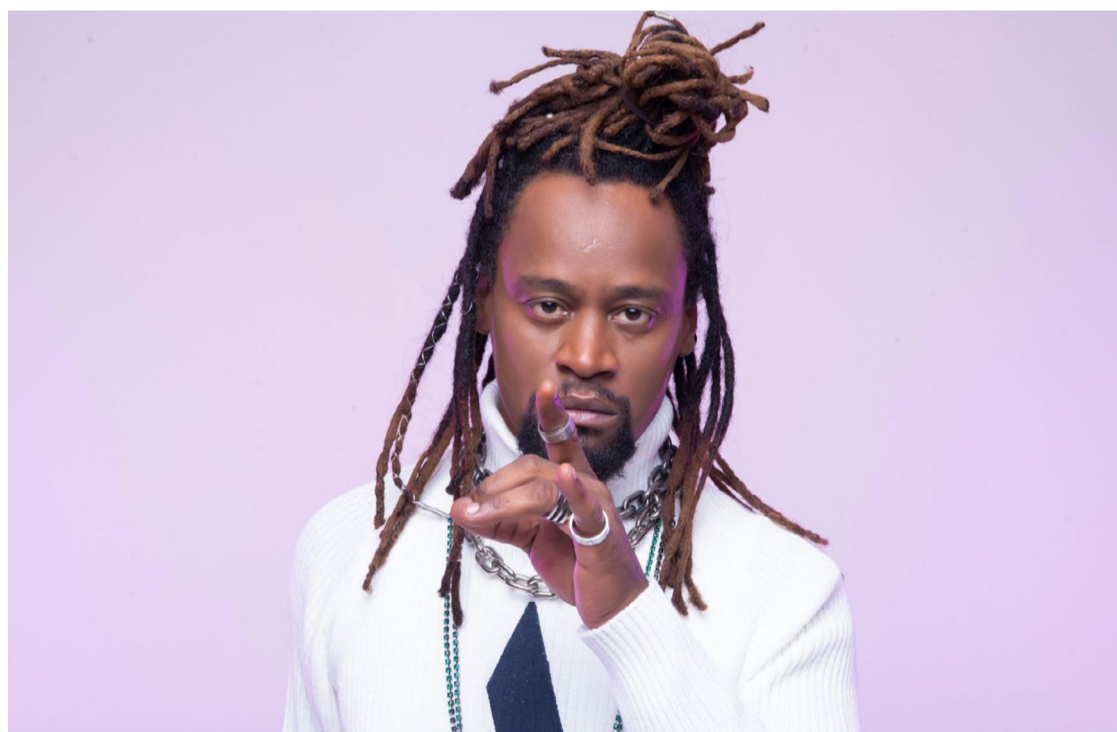
Marca registrada: Toni Garrido apresenta sonoridade black que o consagrou

no se apresenta neste local na quinta, 5.