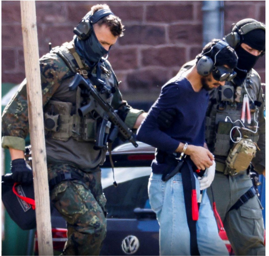
Grupo extremista afirmou que as medidas de segurança não impedirão ações violentas em território alemão

A comunidade muçulmana na Alemanha condenou veementemente as declarações do EI. Líderes islâmicos locais reafirmaram seu compromisso com a paz e a integração, distanciando-se do extremismo violento.