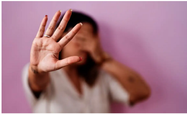
Parcela da população (27%) corresponde a quase 45 milhões de pessoas em todo país

Essa parcela da população (27%) corresponde a quase 45 milhões de pessoas em todo país, e as respostas se referem a agressões praticadas num período de 12 meses anteriores à data da pesquisa. É o crime citado com mais frequência entre 18 situações diferentes aferidas pelo instituto, que vão de as-