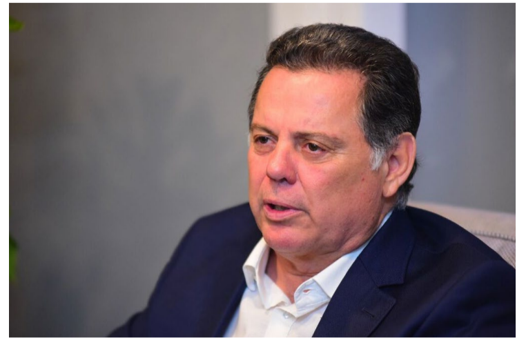
Ex-governador Marconi Perillo