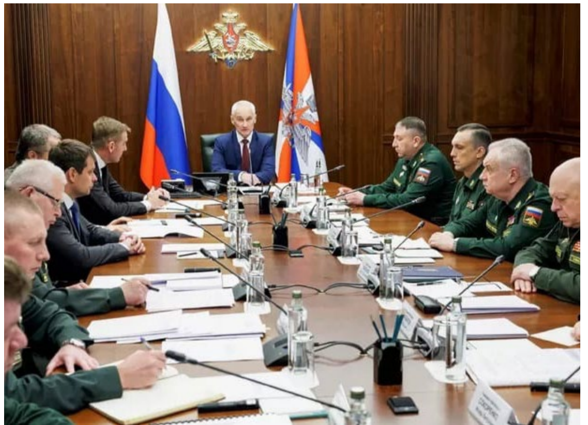
Tropas de Moscou conseguiram romper as linhas de defesa ucranianas em vários pontos

A comunidade internacional acompanha os desenvolvimentos com preocupação. Líderes da OTAN e da União Europeia discutem medidas para intensificar o apoio à Ucrânia, enquanto diplomatas buscam uma solução negociada para encerrar as hostilidades.