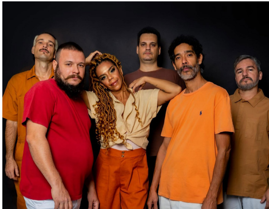
Mundhumano tocará em Pirenópolis repertório de samba-rock

Canto da Primavera transforma Pirenópolis em palco no qual se celebra a música entre hoje e sábado, dia 7. Reportagem do Diário da Manhã traz guia dos principais shows e detalha o que é possível esperar das apresentações. Página 11